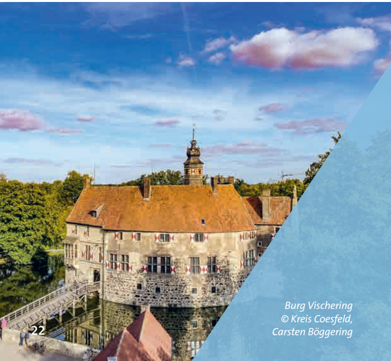
Burg Vischering

Zusammen schafft das Künstlerduo Isa Dahl und Daniel Wagenblast eindrucksvolle Kompositionen aus figurativen Skulpturen und detaillierter Malerei, die sich in Farben und Formen auflösen. Verschiedene Ansätze und Techniken treten im Ausstellungsraum miteinander in einen künstlerischen Dialog und spielerisch werden Proportionen neu verhandelt. Themen wie Nähe, Austausch, Kommunikation und Zusammenhalt stehen in den Arbeiten von Isa Dahl und Daniel Wagenblast im Fokus.