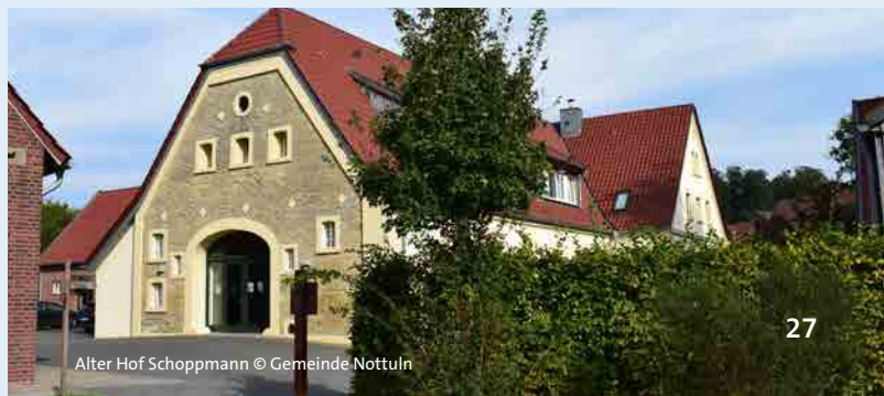
Alter Hof Schoppmann

In der wunderbaren Landschaft der Baumberge verbinden sich Kunst, Kultur und Kulinarisches zu einer stimmungsvollen Einheit. Die emotionale Begegnung mit Kunst, die Begeisterung für das Musische und das persönliche Erleben stehen im Vordergrund. Viele private Gärten und Räume sowie Einrichtungen bieten eine gastfreundliche Bühne, auf der Kunstschaffende ihre Werke und kreativen Aktivitäten vorstellen können. Ein interessantes Rahmenprogramm mit Lesungen, Gesang und Führungen gehört ebenso zur Daruper Landpartie, wie kulinarische Angebote. So können die Besuchenden durch den Ort schlendern, vieles entdecken und einen gemütlichen Tag in Darup verbringen.