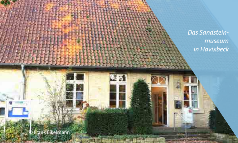
Das Sandstein- museum in Havixbeck