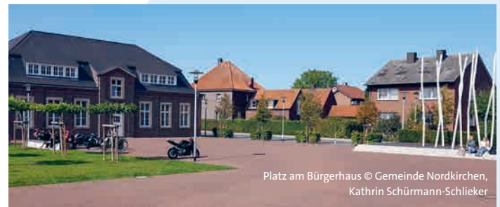
Platz am Bürgerhaus